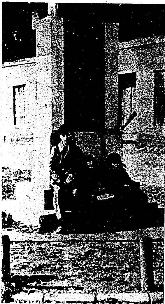
! אויף דער פאטאגראפיע זעט מען דריי קינדער זיצן אויפן דענקמאל : צוויי יודישע אין איינס א פוילישע.